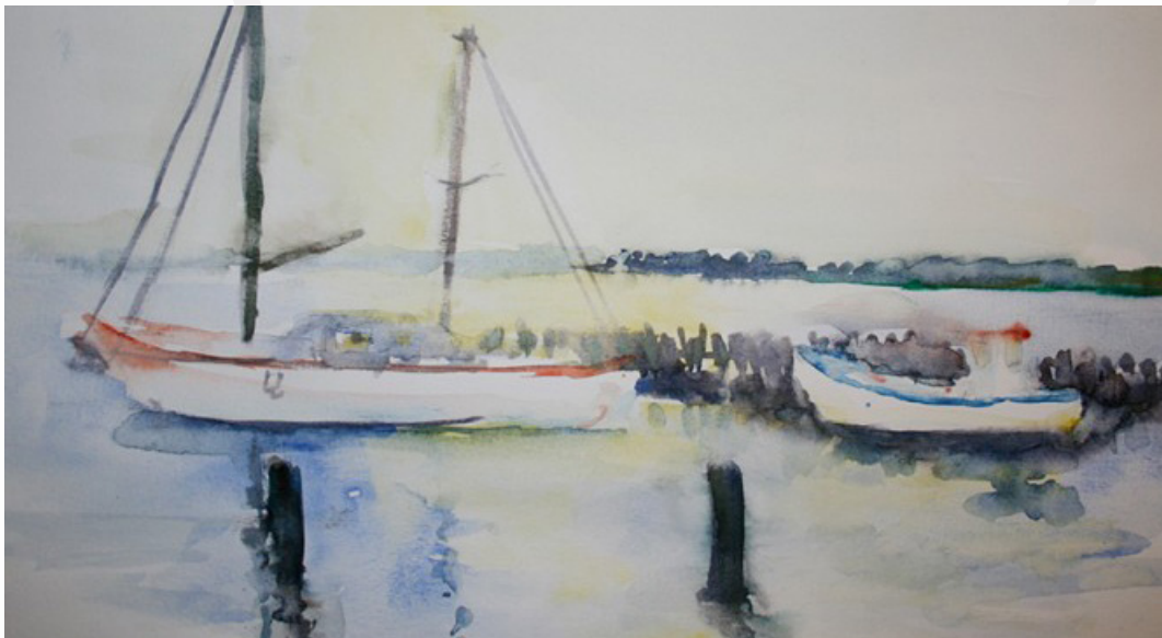
Illustration René Lundby

For afgifter opkrævet af havnefogederne eller kommunen 2015 gældende takster.